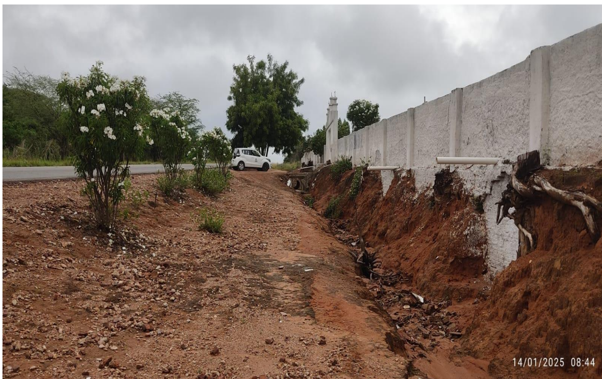
Foto: 2 Frente do cemitério