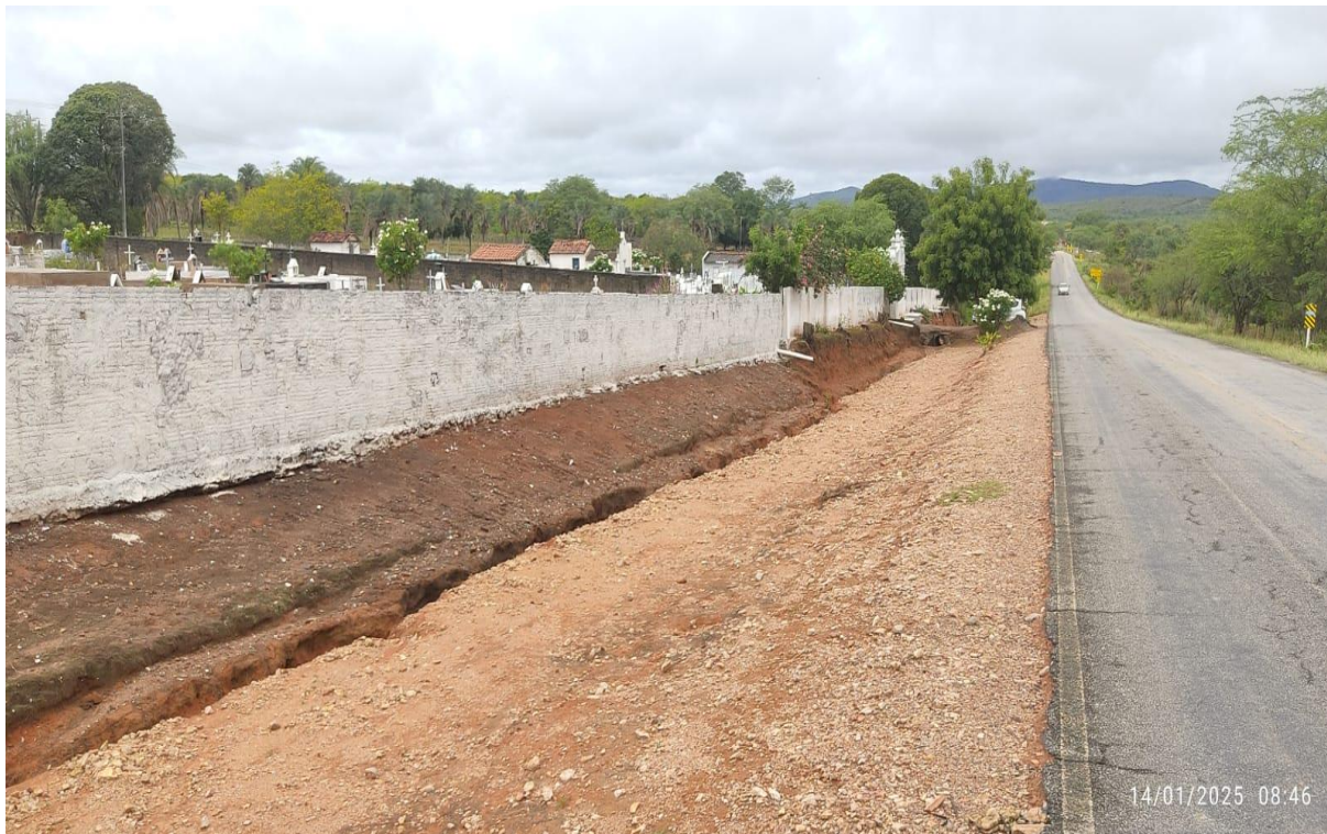
Foto: 1 Frente do cemitério

Centro – CEP: 44750-000 / Tel: 74 3634-2263 / Caldeirão Grande-BA